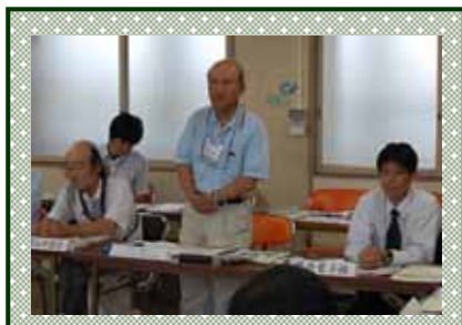
参加団体による団体自己紹介