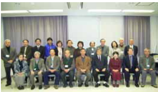
第2期 RESH 終了式にて

最終講座(第7回)を開催。第2期を終了しました。第2期の受講生は少人数ながら熱心な方が多く、12人が修了証を手に入れました。修了生は自然エネルギーへの理解、想いが深まり、今後自らの生活環境の改善さらには地球温暖化防止につながる自然エネルギー普及への地域活動の核となって大いに活躍していただけるものと思ひます。