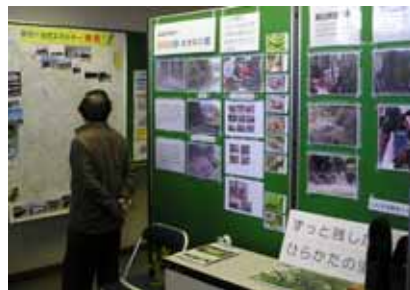
尊延寺の自然を守る会 「里山保全・鼻の保護活動」