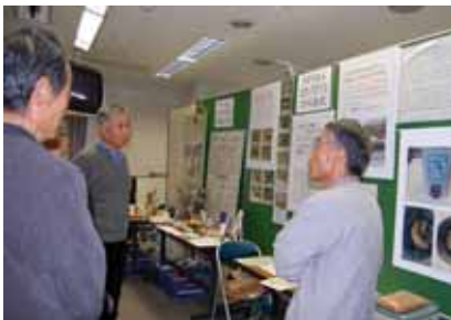
エコ・スマイルひらかた 「生ごみの堆肥化・ごみ減量」

「一人ひとりが環境問題を真剣に捉え、実行に移すことが最重要」という声。今後もエコフォーラムが、来場者と参加団体が想いを共有し、信頼関係を深めていけるような場として発展していけるよう、努力していきたいと思ひます。