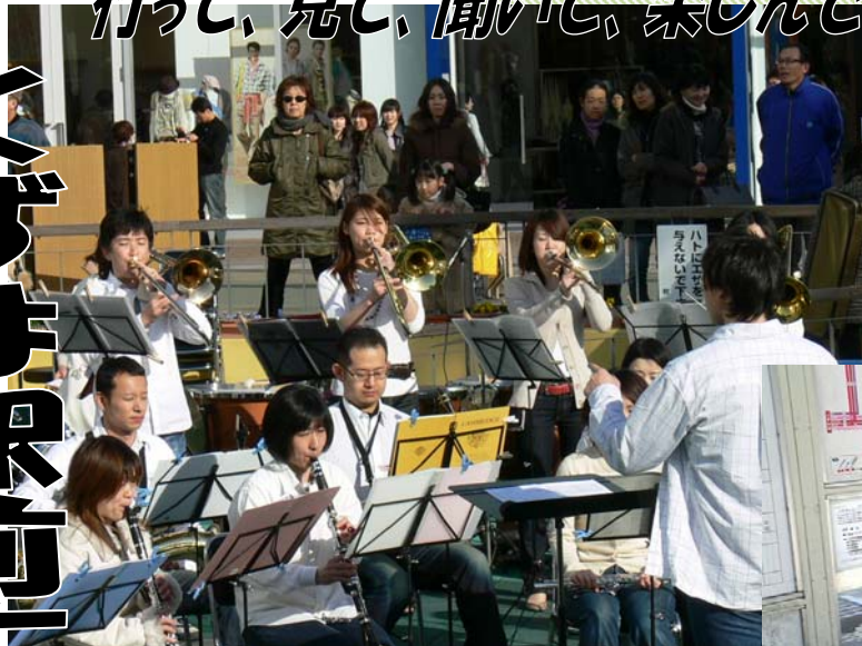
↑ 「吹奏楽団 Stage」の演奏