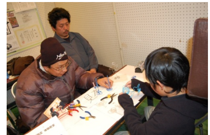
エコ手づくりの会楽々ひろば