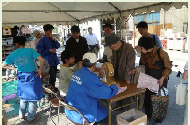
山野酒造ガラガラ抽選会場