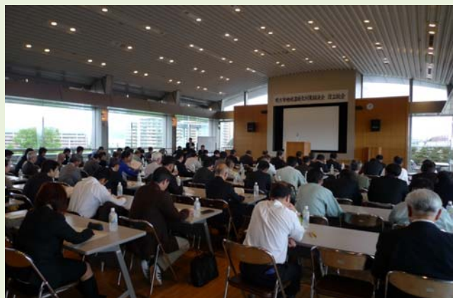
ラポールひらかたで開催された設立総会

ひらかた環境ネットワーク会議では、この協議会と地球温暖化対策について連携していく予定です。