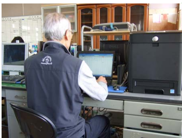
パソコンで作業をするPFI事業担当者

業務の遂行にあたり、サプリ村野にあるひらかた環境ネットワーク会議の事務所内に、専用のパソコンやプリンターを設置するとともに、環境教育サポート部会内で事業専属の担当者を決めて業務に従事しています。