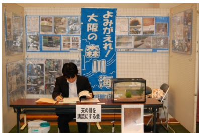
天の川を清流にする会