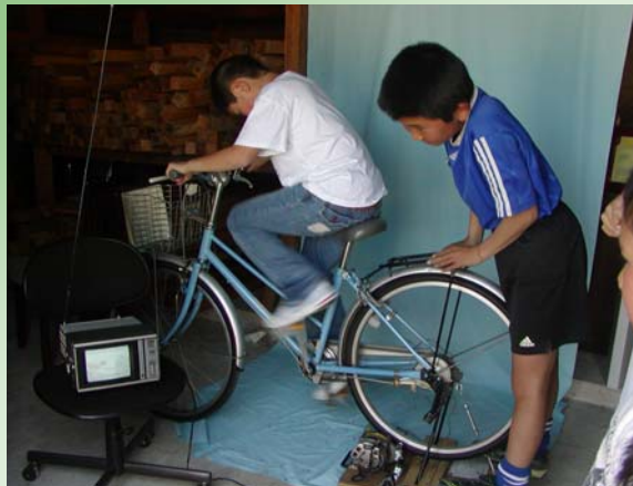
TVが映る自転車発電装置に挑戦