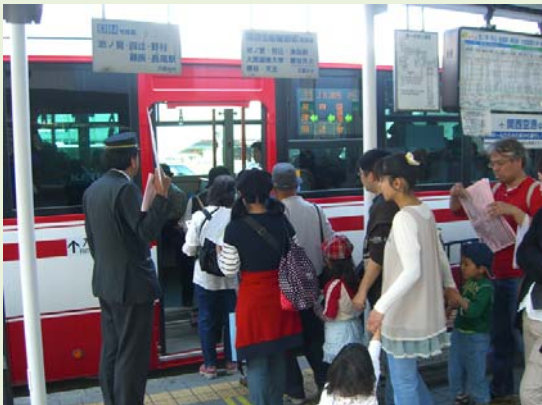
枚方市駅南口津田駅行きバス