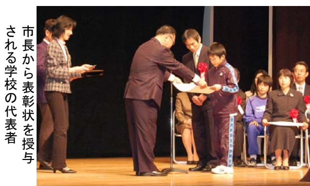
市長から表彰状を授与される学校の代表者

今回は「取り組もう環境保全！ 発揮しよう“地域力”」をテーマに、校区コミュニティに加え、市内でよりよいまちづくりを目指し活動している団体やグループ、個人の方々を広く対象とし、約200名の参加者がありました。