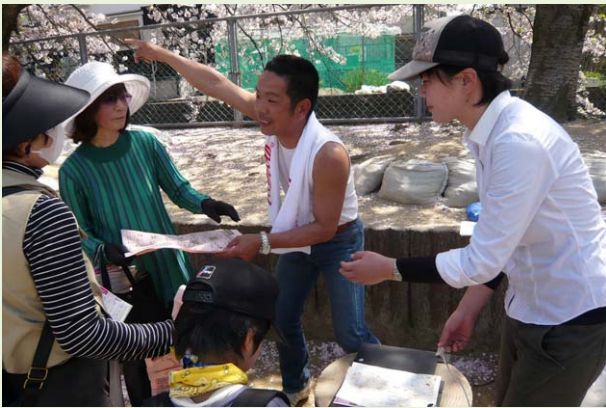
免除川(長法寺小学校ポイント)