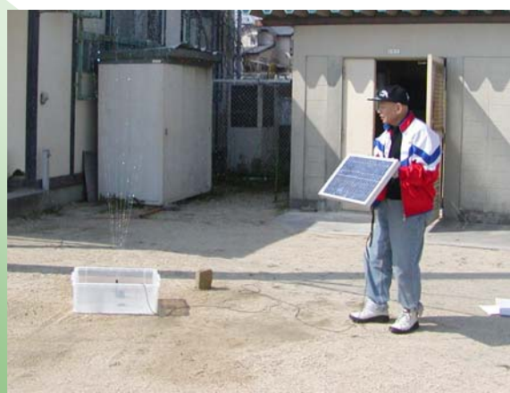
環境学習に使用する太陽光発電の噴水装置