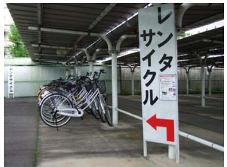
レンタサイクルステーション