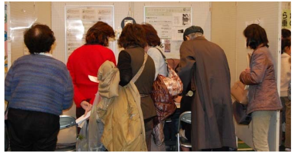
ブース展示を見学する参加者