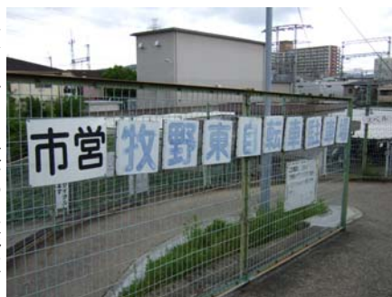
レンタサイクルがある牧野東自転車駐車場

温暖化防止のためにも、マイカーの利用を控えて、自転車や公共交通の利用を心がけたいですね。そのためにもこうしたレンタサイクルがもっと整備されるといいのですが…。