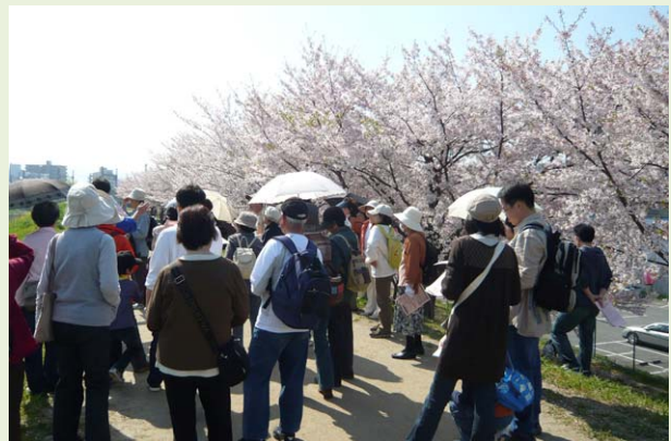
秘密ポイントは天野川