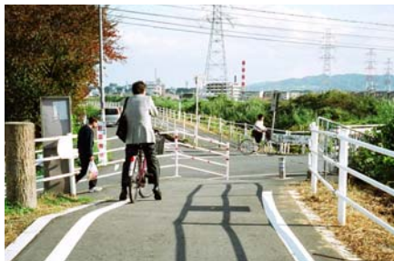
穂谷川の堤防を気持ちよくサイクリング