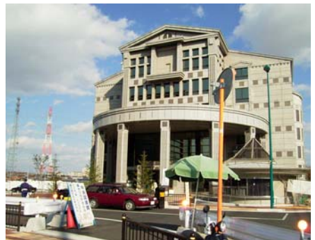
牧野駅から10分ほどで中央図書館に到着