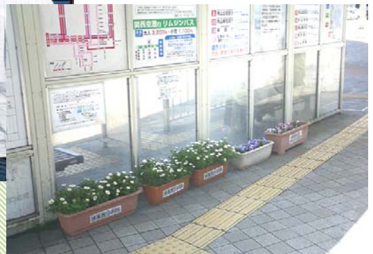
↓ プランターで飾られた駅周辺

この会報でも過去 2 回取り上げた「樟葉駅前を面白くするワークショップ」ですが、4 回に渡るワークショップを行い、3 月 15 日に「樟葉駅前を面白くするイベント」を開催しました。