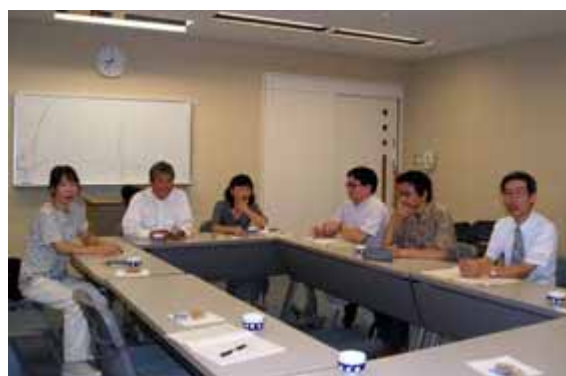
団体会員から多くの意見が寄せられた

体6人、午後の部（事業者）に6団体8人、夜の部（市民団体）に2団体2人が参加し、運営委員や事務局などと活発な意見交換を行いました（下欄参照）。