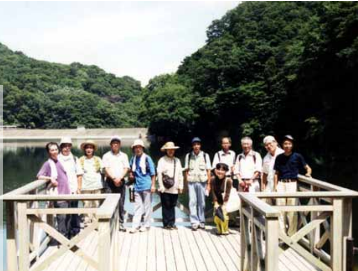
「天の川源流探索」に参加した自然環境部会メンバー